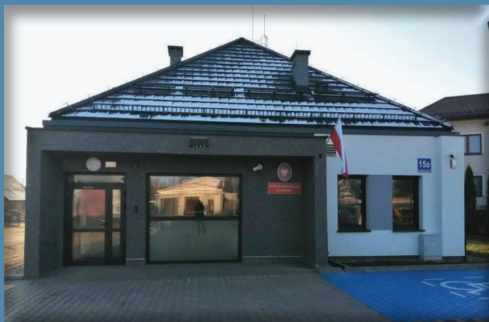
Nowy Posterunek Policji w Sztabinie

Poczucie bezpieczeństwa mieszkańców naszej społeczności oraz niski stopień przestępczości są jednym z czynników świadczących o rozwoju i atrakcyjności gminy. Podstawowym organem państwa powołanym do zapewnienia bezpieczeństwa i porządku publicznego jest Policja. Zgodnie z ustawą Policja jest umundurowaną i uzbrojoną formacją służącą społeczeństwu i przeznaczoną do ochrony bezpieczeństwa ludzi oraz do utrzymywania bezpieczeństwa i porządku publicznego. Troska o porządek publiczny jest więc zadaniem bardzo istotnym w moim przekonaniu. Dlatego tak istotne było ponowne przywrócenie jednostki POLICJI w Sztabinie.