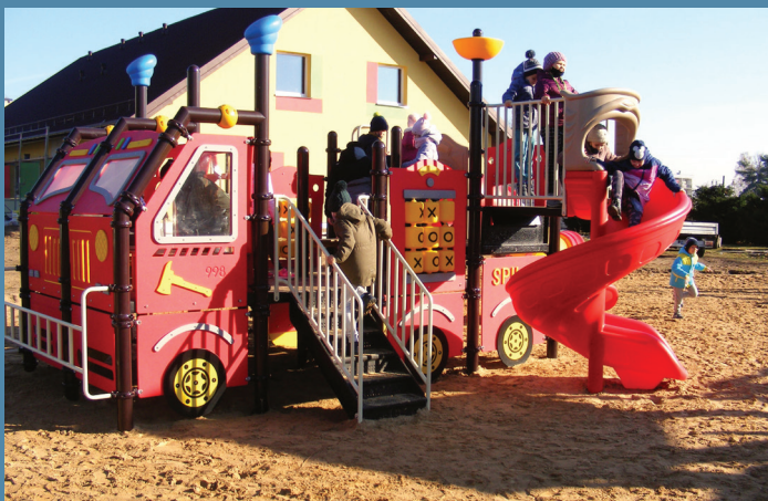
Plac Zabaw w Sztabinie

6. Budowa obwodnicy Sztabina. Zadanie rozpoczęto w roku 2023. Poprawa bezpieczeństwa na drogach, wyprowadzenie ruchu z zatłoczonych miast, czystsze powietrze, mniejszy hałas i poprawa przepustowości sieci drogowej – to główne założenia opracowanego w Ministerstwie Infrastruktury Programu Budowy 100 Obwodnic na lata 2020-2030. Obwodnica ma być gotowa wiosną 2025 roku.