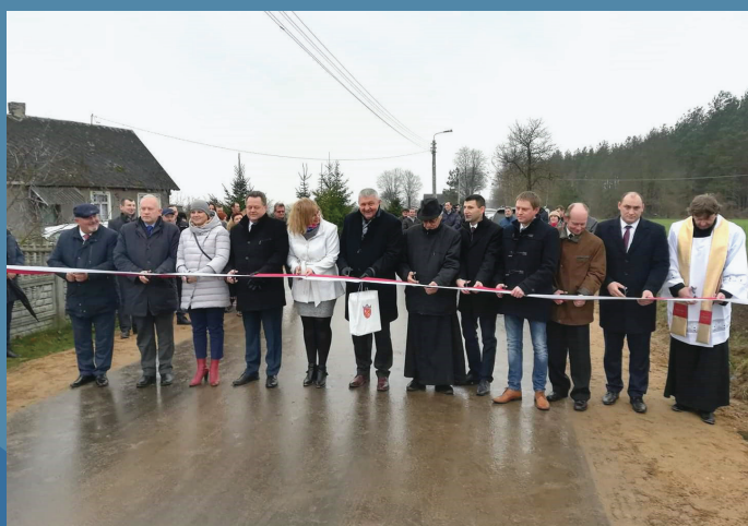
Otwarcie drogi Lebiedzin

W ramach tego działania wyremontowano również drogę gminną Dębowo - Jagłowo i rozbudowę skrzyżowania z drogą powiatową.