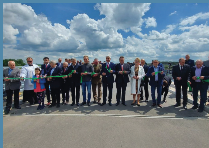
Otwarcie mostu na Biebrzy w Jagłowie

1. Przebudowa dróg we wsiach: Lebiedzin, Krasnybór, Sosnowo, Dębowo, Polkowo, Jaziewo, Huta, Kopiec i Sztabin. Zadanie zrealizowano ze środków Rządowego Funduszu Dróg.