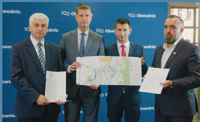
Podpisanie umów na obwodnicę Sztabina

10. Modernizacja kotłowni w budynku Ośrodka Zdrowia i GOPS w Sztabinie. Zadanie zrealizowano z budżetu Funduszu Ochrony Środowiska i Gospodarki Wodnej w Białymstoku.