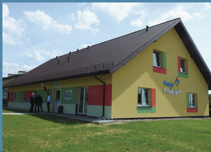
Budynek nowego przedszkola w Sztabinie

17. Unowocześnienie e-usług w Gminie Sztabin. Zadanie zrealizowano w ramach Regionalnego Programu Operacyjnego Województwa Podlaskiego.