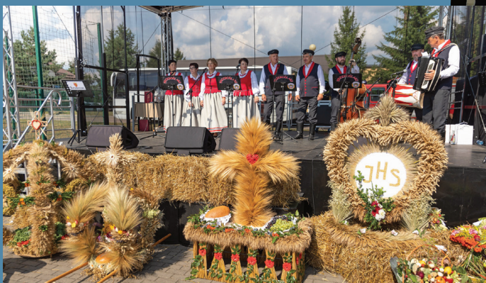
Święto Plonów w Sztabinie

Niezwykle istotna jest zapewne współpraca z Rolnikami. Wyrazem tego są organizowane co roku Dożynki. Jako uroczystość o wieloletniej tradycji są symbolem szacunku dla ciężkiej pracy rolnika oraz stanowią wyraz wdzięczności za jego