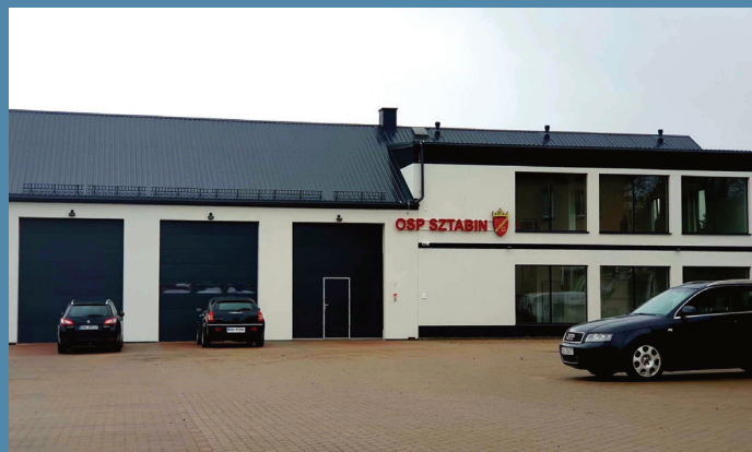
Nowy budynek OSP w Sztabinie

16. Budowa budynku garażowo – usługowego w Sztabinie na potrzeby jednostki Ochotniczej Straży Pożarnej wraz z punktem sprzedaży produktów tradycyjnych, regionalnych i lokalnych. Zadanie zrealizowano w 2023 r. dzięki dofinansowaniu z Funduszu Wsparcia Gmin i Powiatów utworzonego przez Marszałka Województwa Podlaskiego oraz Rządowego Funduszu Polski Ład: "Programu Inwestycji Strategicznych".