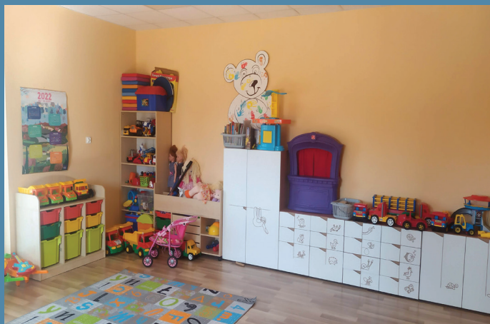
Wyposażenie nowego przedszkola w Sztabinie

20. Zakup wyposażenia do Świetlicy Wiejskiej w Sztabinie oraz mobilnej sceny na użytek mieszkańców gminy w ramach podniesienia standardów kulturalnych i społecznych w Gminie Sztabin. Środki pozyskano z budżetu Województwa Podlaskiego w ramach „Programu odnowy wsi województwa podlaskiego – Kreatywna wieś” oraz Ministerstwa Kultury i Dziedzictwa Narodowego.