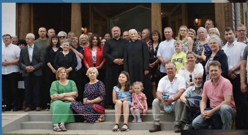
80 lecie Kaplicy w Jagłowie

przez miejscowe organizacje pozarządowe. Wraz z radnymi dbamy o to żeby pamiętać o corocznych spotkaniach jubileuszowych najstarszych stażem par małżeńskich. Cyklicznie też organizujemy spotkania opłatkowe z przedstawicielami nieformalnych grup społecznych i organizacji zrzeszonych. Należy pamiętać, że gmina to nie tylko urząd i dobrze jest zadbać o dobrą współpracę