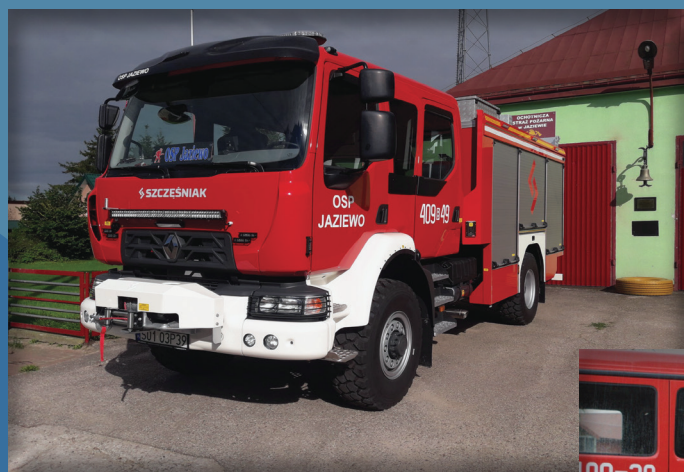
Nowy wóz w OSP Jaziewo

OSP: Sztabin, Jaziewo, Polkowo, Jagłowo, Mogielnice, Jaminy, Krasnydwór oraz Jastrzębna. Służący w nich strażacy reagują na każde zagrożenie zgodnie z rolą jaką sobie wyznaczyli. Gmina Sztabin w latach 2018-2023 otrzymała od samorządu wo-