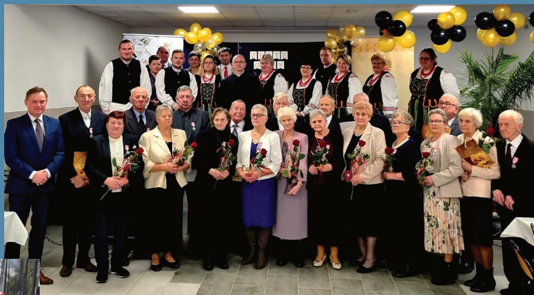
Jubileusz Złotych Godów w Sztabinie

Właściwe relacje z Mieszkańcami naszej gminy chciałbym opierać przede wszystkim na zaufaniu. Zależy mi na dobrej współpracy z radą gminy, radami sołectkimi, organizacjami pozarządowymi, rodzicami dzieci i młodzieżą, nauczycielami, pracownikami urzędu gminy i jednostek organizacyjnych itd. Uważam, że jest to gwarancją dobrej współpracy dla rozwoju gminy. Staram się wspierać i integrować różne środowiska.