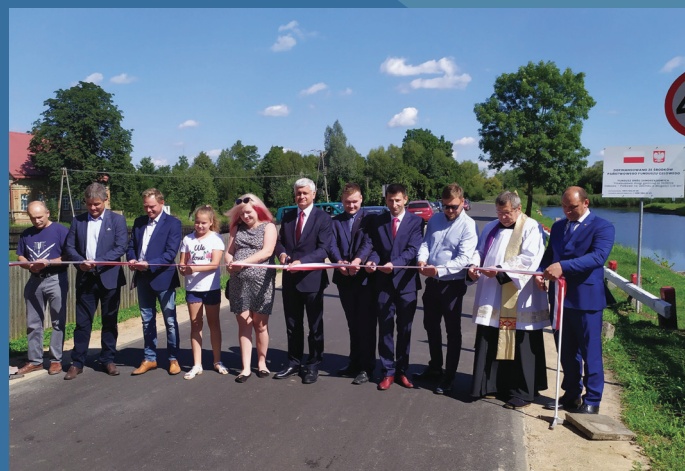
Otwarcie drogi Polkowo

5. Przebudowa dróg we wsiach: Ostrowie, Jastrzębna Druga, Jasionowo k/Krasnegoboru, Komaszówka, Ściokła, Budziski, Ewy, Jasionowo Dębowskie, Kopytkowo, Czarniewo, Długie, Cisów, Podcisówek, Krylatka, Kamień, Krasnoborki. Zadanie zrealizowano w ramach Rządowego Funduszu Polski Ład: „Programu Inwestycji Strategicznych”.