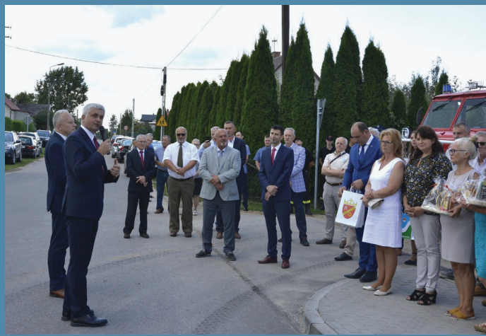
Otwarcie drogi Wrotki - Jaziewo

Dotychczas udało się zrealizować ponad 38 km inwestycji dotyczących modernizacji i budowy dróg: